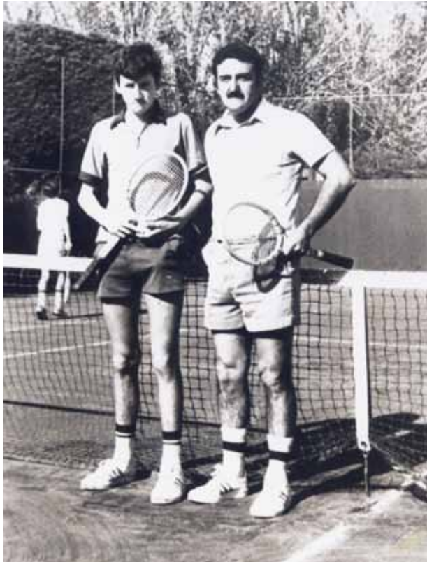
Giuria e Hijo