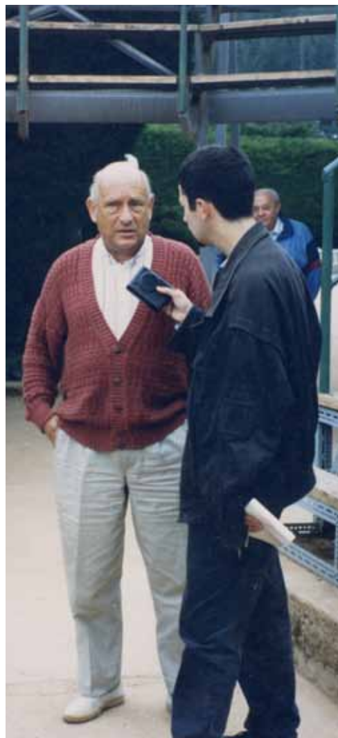
Tenis de Cofraternidad Interclubs: Visita de Andino Tennis Club Mandoza/Argentina - CochaBamba Tennis Club/Bolivia “Club de Tenis Unión” Viña del Mar/Chile Diciembre 1995